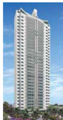
GRAND PARC RESIDENCIAL RESORT BAIRRO: ENSEADA DO SUÁ, VITÓRIA QUARTOS: 4