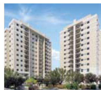
RESERVA VERDE BAIRRO: LARANJEIRAS, SERRA QUARTOS: 3 E 4