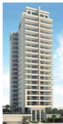
LA PLAGES RESIDENCIAL CLUB BAIRRO: PRAIA DA COSTA, VILA VELHA QUARTOS: 3 E 4